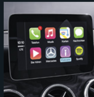
Smartphone terintegrasi (Apple CarPlay™ dan Android Auto™)