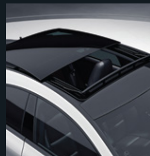
Panoramic sliding sunroof