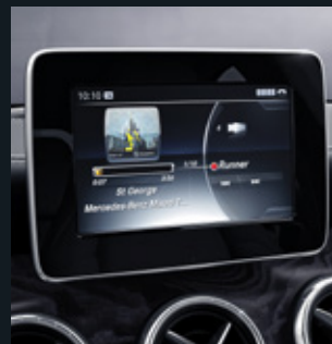
Audio 20 USB